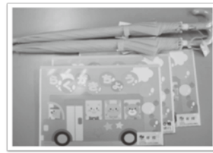
子育て支援事業 新入学児童へ交通安全の贈呈 園児へらくがき絵等の贈呈

問合せ先 担当/総務課 法人運営係 TEL 597-4848 soumu@hinodeshakyo.jp