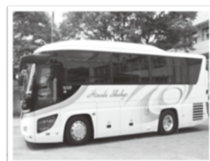
社協バス運行事業 運行経費(車検・燃料費など)