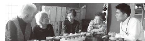
まだ、始めたばかりですが、みなさん楽しんで下さっておしゃべりを楽しんでいます。

このような取り組みは、高齢者の方を地域社会から孤立させない、また、介護予防の観点からもとても重要な取り組みです。これからは社会福祉協議会では、福祉協力員の皆様の地道な活動を支えられるよう努力してまいります。