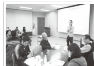
ボランティア活動推進事業 各種講座の経費