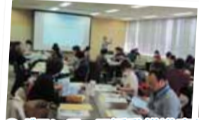
◎ボランティア活動推進事業 各種講座の経費