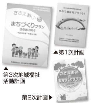
▲第1次計画 ▲第3次地域福祉活動計画 第2次計画▶