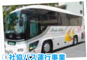
◎社協バス運行事業 運行経費(車検・燃料費など)

「みんなでささえあい ともに生きていく やさしいまちづくり」を推進するための財源として事業の趣旨に賛同していただける住民のみならず、町内事業所のみなさまを対象としています。決して強制ではありませんが、1人でも、1事業所でも多くのみなさまに、事業の趣旨にご理解とご賛同をいただき、ご加入いただきまして、その会費を社会福祉事業推進のための貴重な財源として活用させていただきますので、ご協力をお願いいたします。