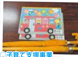
◎子育て支援事業 新入学児童へ交通安全傘の贈呈 園児へらくがき帳等の贈呈