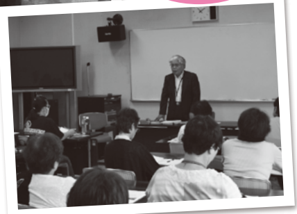
傾聴ボランティア養成講座