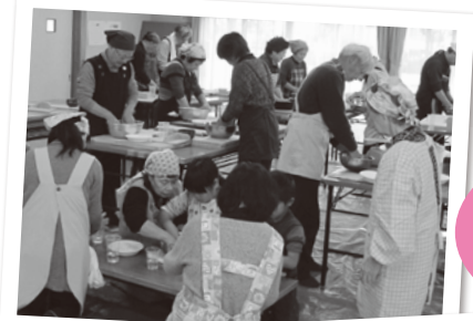
福祉協力員活動 (そば打ち)

・在宅の要介護高齢者(介護用品)・在宅介護者支援事業・一人暮らしの高齢者年賀状 ・福祉協力員活動・ボランティア活動・子育てサロン・映画会・その他福祉に関する講演会や学習会等 これからも歳末たすけあい運動にご理解ご協力を賜り、みなさまと共に地域福祉の充実を目指してまいります。