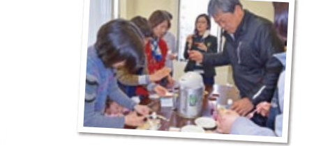
会場を一部パーティションで仕切ってキッズスペースを作り、子どもからは保護者が見える形で実施したため、子どもも、参加者も集中できました。講師からも非常にやりやすかったと感想をいただきました。