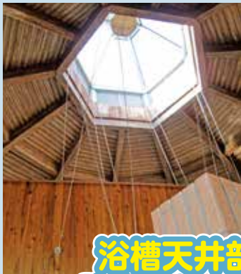
浴槽天井部、ホールが吹き抜けて開放的です!!