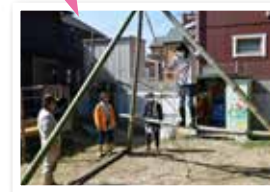
月に1度、場の整備(草刈りや遊具のメンテナンスなど)やミーティングもおこなっています。大久野小学校横で活動しています。詳しくはお問合せください。