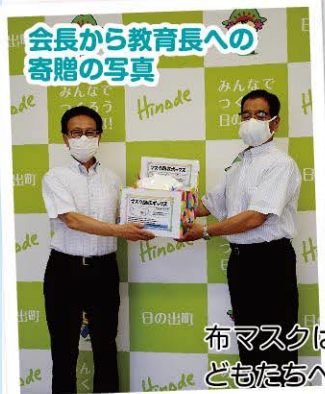
会長から教育長への寄贈の写真