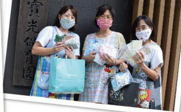
宝光保育園さんがたくさんのマスクを作ってくれました! 布マスクは、町内の小学校へ寄贈し、子どもたちへ学校を通して配布します。