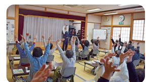
年忘れ健康サロン【10自治会】

活動をすすめる中で私たちが何よりも大切にしていることは、活動の主役はそこに暮らす住民の皆さまであるということです。これからはずっと住み続けていきたいと思える町づくりに向けて一緒に取り組んでいきましょう!