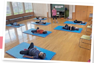
平井センター実施 元気なるなる体操