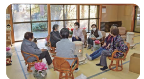
ほんにいいわ会【19自治会】