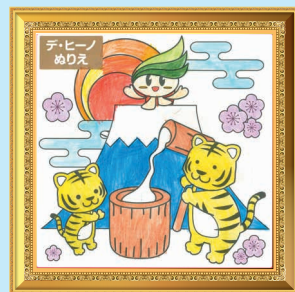
いとつみれあさん