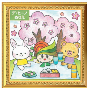
エミーちゃんさん