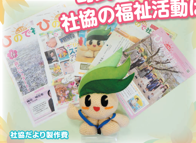
社協だより製作費