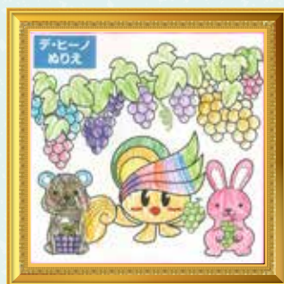
ひがしくまっちゃん